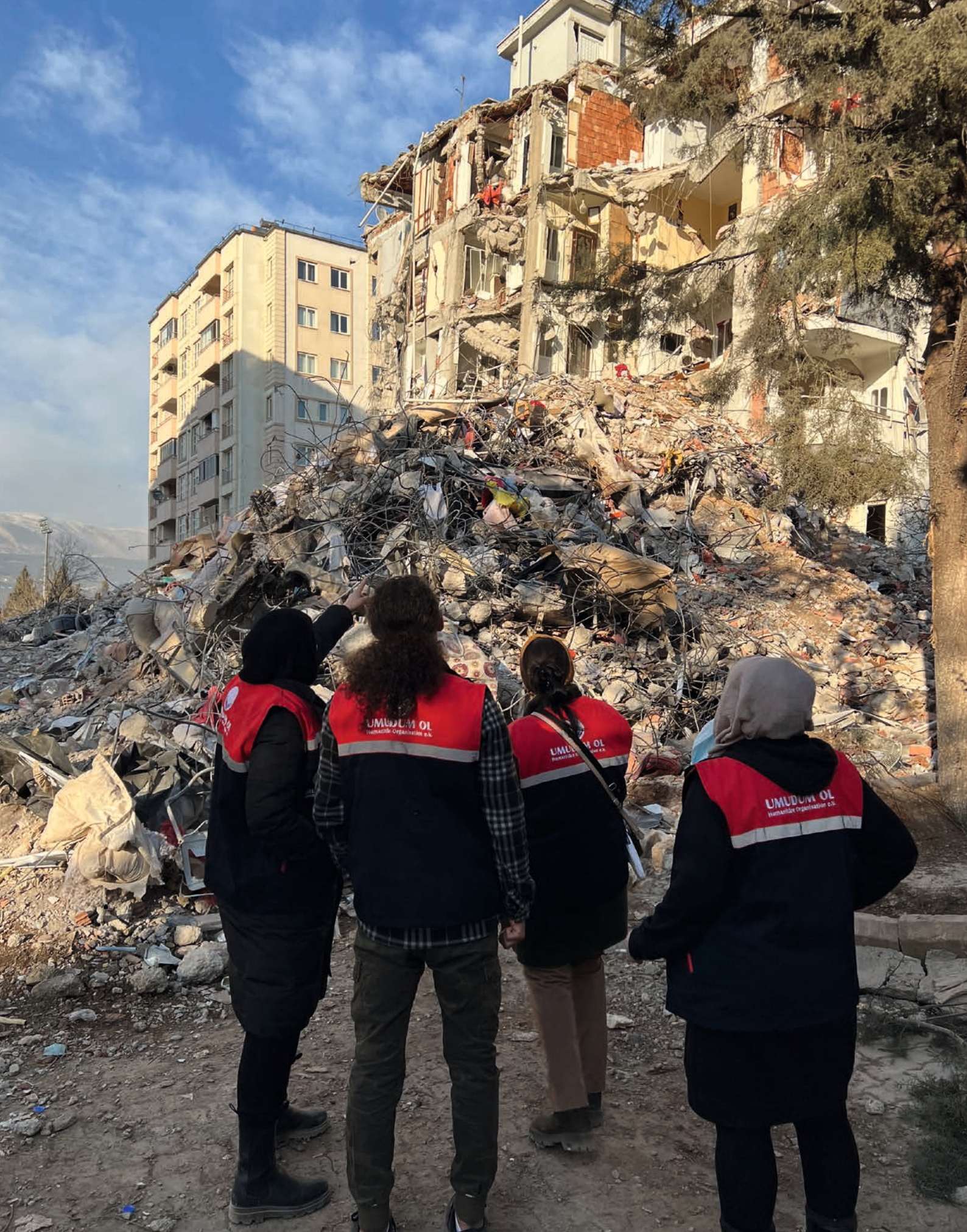
Im zerstörten Kahramanmaraş helfen Ehrenamtliche der Hilfsorganisation Umudum Ol. Übersetzt heißt das „Sei meine Hoffnung“