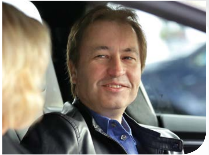
Heinz-Harald Frentzen nutzt auch im eigenen Haus sämtliche energetischen Raffinessen

In seiner Karriere als Formel-1-Rennfahrer hatte Heinz-Harald Frentzen oft die Nase vorn. In 157 Grand-Prix-Rennen hat der Vizeweltmeister bewiesen: Seine Ziele verfolgt er mit Engagement und Leidenschaft. Heute gibt der 51-Jährige beim Energiesparen Gas. Wie er mit Strom auf Touren kommt und wie er beim Hausbau zum Spar-Weltmeister wurde, erzählt er im Interview.